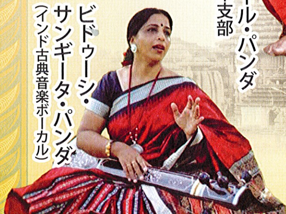
ビドゥーシ・ サンギータ・パンダ (インド古典音楽ホーカル)