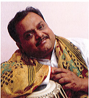
パンディット・プロセンジット・ポダル (北インド古典音楽 タブラ奏者) Pt. Prosenjit Poddar (Tabla)

シタール奏者だった父ラダ・クリシュナ・ポダルの影響で、5歳で tabla を始める。インド人間国宝パドマブーシャン・ビシュワ・モハンバット(ビーナ奏者)など、巨匠と多く共演。USA、ヨーロッパ、カナダなど世界中で公演やワークショップを開催。